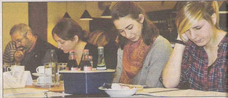
Hier werden schon mal Texte studiert, um sich beim Casting bestens zu präsentieren.